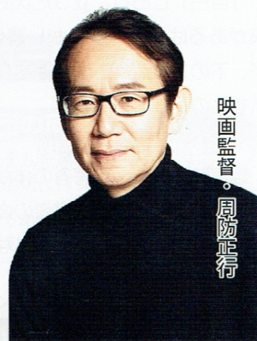
映画監督・周防正行